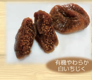
有機やわらか 白いちじく

有機トンプソンレーズン、有機カラントレーズン、有機サルタナレーズンをミックスしました。