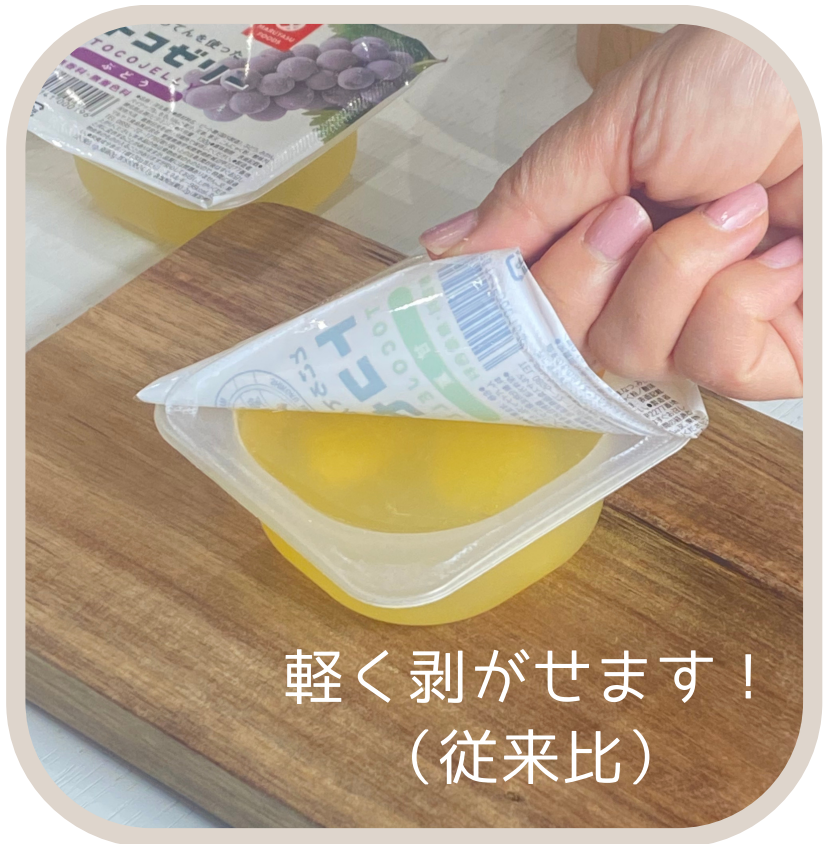
軽く剥がせます！ (従来比)