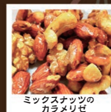
ミックスナッツのカラメリゼ