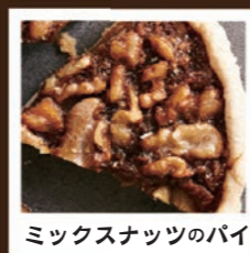
ミックスナッツのパイ