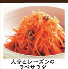
人参とレーズンのラベサラダ