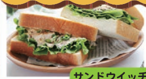
サンドウィッチに