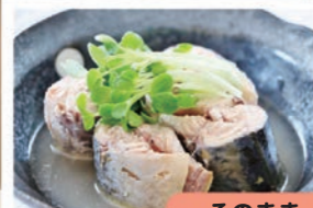
そのまま盛り付けて